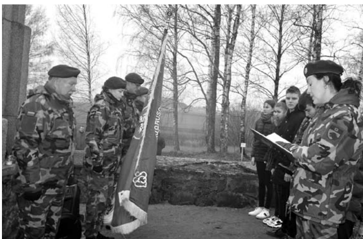
Iškilminga svėdasiečių jaunųjų šaulių priesaikos akimirka.