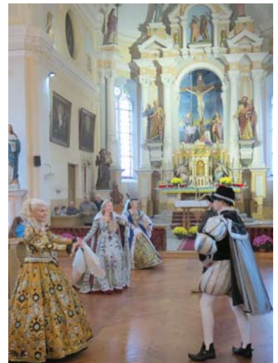
Šoka Istorinio šokio studijos „Baltoji pavana“ šokėjai.