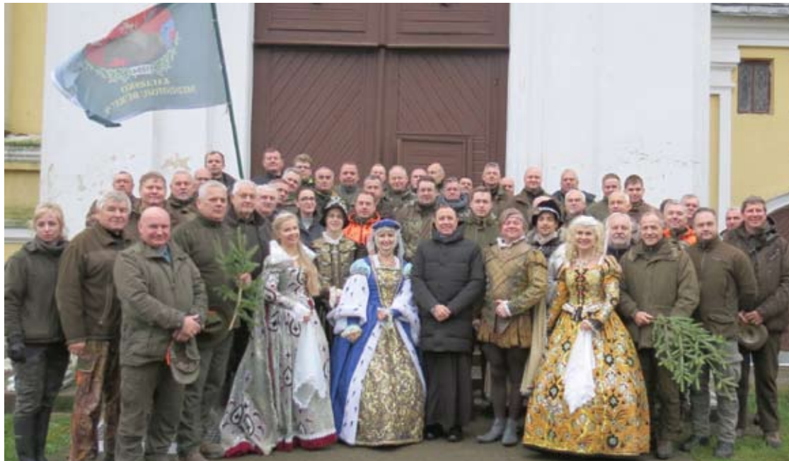
Nuotrauka po sekmadienio, lapkričio 3 dienos, Šv. mišių Kavarsko Šv. Jono Krikštytojo bažnyčioje.