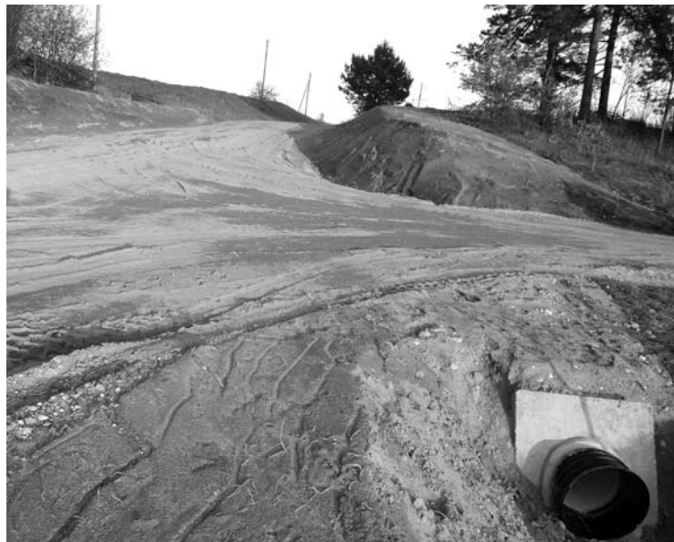
Bajorų kaimo (Svėdasų sen.) Pajario gatvės gyventojai pagaliau gali važinėti valdišku keliu, o ne per žmogaus kiemą.

Spalio pradžioje nuvažiuojame į Bajorų kaimą. Pasirodo, valdininkai, kai nori, žmonių problema gali išspręsti staigiai. 100 - 200 metrų kelio ruožas, kuris anksčiau buvo tikra klampynė, nupiltas žvyru, įdėta pralaida, todėl net po lietingo laikotarpio jis pasidarė visai padoriai tinkamas eksploatuoti.