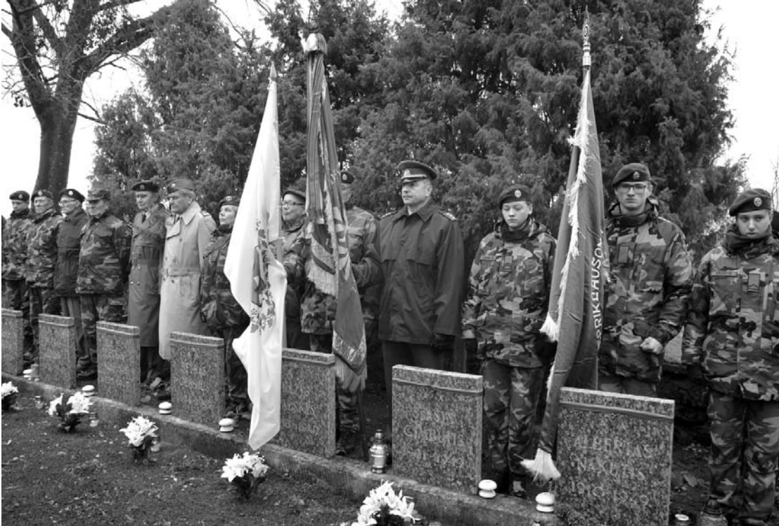
Garbės sargyboje šalia partizanų kapų išsirikavo Lietuvos kariuomenės kūrėjų savanorių sąjungos nariai, Lietuvos šauliai ir kitų patriotinių organizacijų atstovai.

Praėjusį sekmadienį, lapkričio 3-iają, Svėdasų krašte buvo iškilmingai pagerbti Lietuvos Laisvės kovų dalyviai, prieš 70 metų žuvę Drobčiūnų miške ir palaidoti Kunigiškių kapinėse.